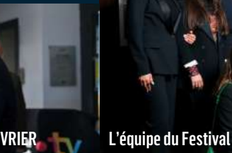
L'équipe du Festival