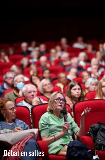
Débat en salles