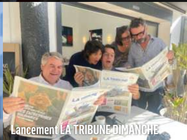
Lancement LA TRIBUNE DIMANCHE